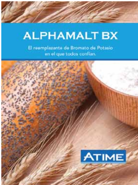
Flyer de producto