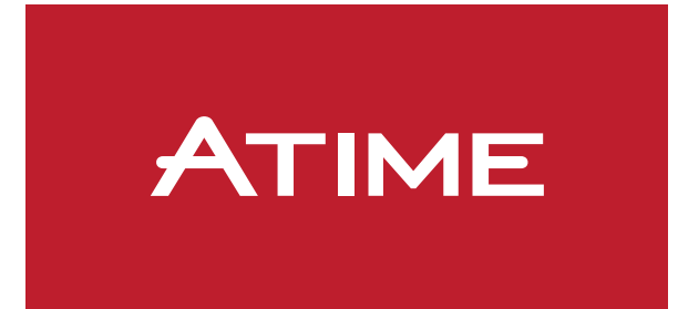
Ej. fondo color A