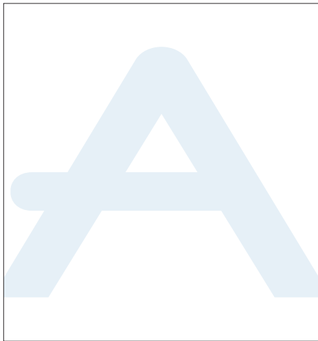
Ej. a. Color al 10%