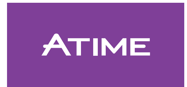
Ej. fondo color C

Aplicación de logotipo sobre una foto. El mismo no lleva borde ni sombra y debe aplicarse siempre que el fondo sea claro y permita su correcta lectura. De lo contrario, se sugiere aplicar el logotipo sin fondo, en blanco.